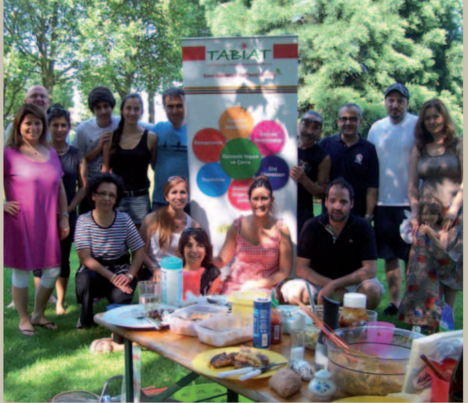
Plastiğe, tek kullanımlık malzemelere ve gereksiz yere paketlenmiş ürünlere yer verilmeyen piknikte koristler hatıra fotoğrafı çekirdi.

Piknik sonrasında görüldü ki gerçekten de ortaya çıkan çöp normale göre kıyaslanamayacak kadar azdı. Koca piknikten çıkan çöp, topu topu yarım poşetten ibaretti.