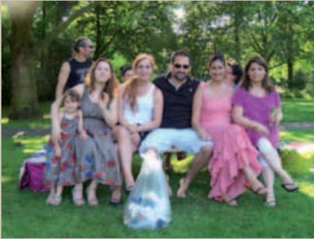
Piknik alanını tertemiz terkeden ve sadece yarım poşetlik çöp çıkaran piknikçiler „kendi kendimizle yarıştık, bu yarışta evde de sürdüreceğiz“ dediler.

Birkaç yıldan beri bölgemizde çalışmalarını sürdüren Bonn Türk müziği korusu geçtiğimiz günlerde Ren nehri kenarında bir piknik düzenledi. Koro üyeleri ve aileleriyle birlikte büyüklü küçüklü 28 kişinin katıldığı piknikte oyunlar oynandı, yemekler yendi, sohbetler edildi. Üstelik bu yılki pikniğin bir de özelliği vardı. Bu özellik, pikniğin doğa ve çevreye ağırlık verecek olmasıydı. Yapılan hazırlık toplantısında belirlenen hedef „piknikte mümkün olduğu kadar az çöp çıkarmak“ şeklindeydi.