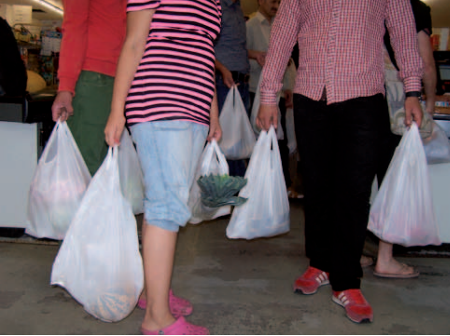
Dünya çapında tüketilen bir trilyon poşet hem insan sağlığını hem de çevreyi tehdit ediyor.

Sağlamlığına göre bir poşetin doğada çürüyüp tamamen yok olabilmesi için 100 ile 500 yıl arasında bir sürenin geçmesi gerekiyor. Ancak çevreye verdiği büyük zararlara rağmen poşetler bol miktarda kullanılıyor. Satıcıların mallarını sormadan ve otomatik olarak